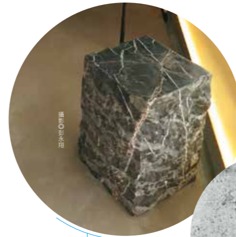
設計集人訂製的手工刻鏤大理石邊桌，自然寫意。