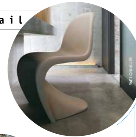
一把Ice Gray的大師之作Panton Chair，畫龍點睛設計態度。